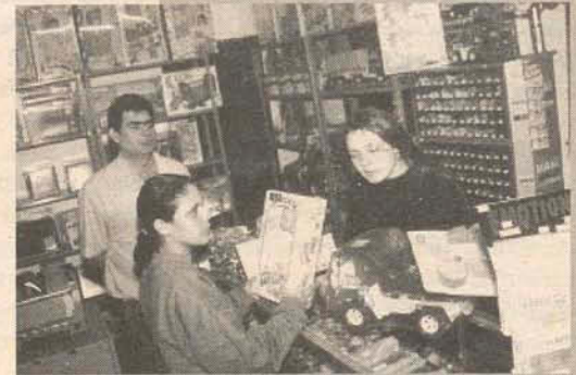
DIVERSOS: Papelaria Atlas amplia seus serviços