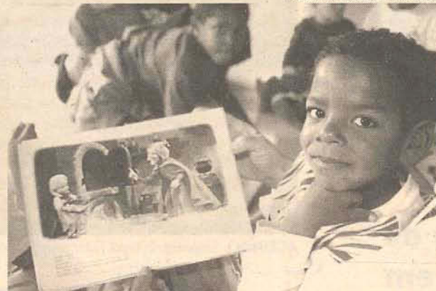
EXEMPLO: Programa atende crianças carentes de 5 a 12 anos de idade

O Projeto Família Saudável, que iniciou suas atividades em junho de 1988 no antigo posto policial do bairro Abraão, vai ampliar sua capacidade de atendimento para 100 crianças, a partir deste mês. A nova creche, erguida com 90% de doações, está em fase final de construção e vai abrigar, nos seus 220 metros quadrados, duas salas de aula, uma secretaria, consultório médico e odontológico e um salão para prática de esporte e manifestações artísticas.