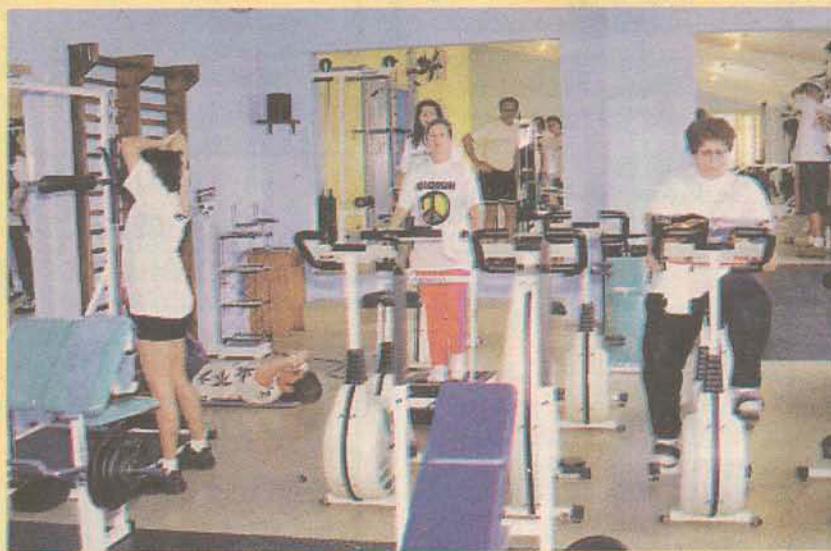
EM FORMA: Academia Companhia do Corpo, oferece exercícios para manter a estética, a reabilitação de lesões e a prevenção de doenças

Companhia do Corpo atende crianças e adultos e oferece horário livre de segunda a sexta-feira, das 7hs30min às 21 horas. Em funcionamento desde agosto de 97, a Companhia do Corpo não trabalha apenas com a promoção da estética. Os equipamentos como bicicleta, esteira, stepper e exercícios aeróbios também são usados no tratamento da obesidade infantil, na reabilitação de lesões e prevenção da LER (Lesões por Esforço Repetitivo). "Adultos e crianças com excesso de peso, colesterol e triglicéridios elevados, devido ao sedentarismo e hábitos alimentares erra-