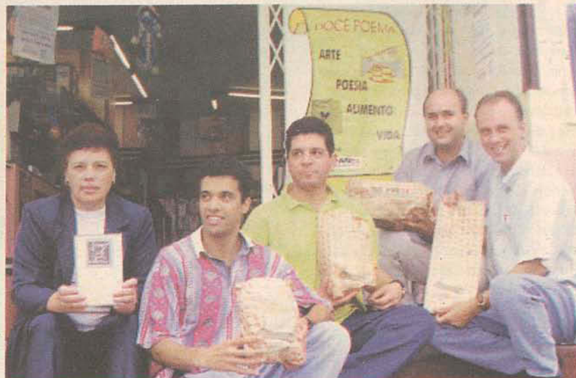
INCENTIVO: Grupo de Poetas Livres assina poesias nas embalagens de pão