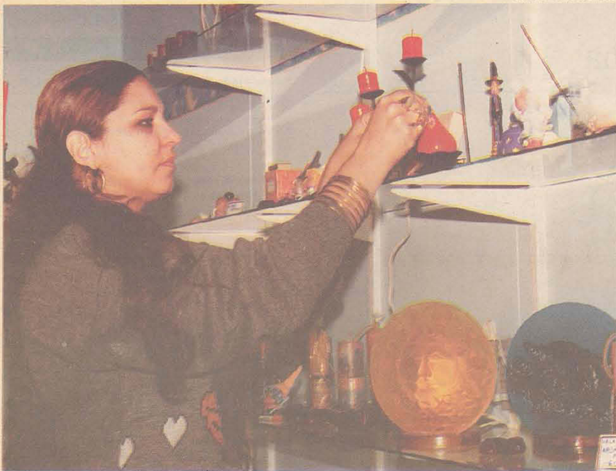
ISABELLA: Esotérico e Cia oferece presentes como velas, saís e incensos, a loja que faltava no bairro

S e você quer dar um presente de bom gosto ou quer decorar a sua casa com objetos que tragam harmonia, sorte e energia positiva, Coqueiros já tem o lugar certo. Desde o dia 4 de setembro está funcionando junto ao Posto BR Cordeiro, no Abraão, a Esotéricos e Cia., uma loja de encher os olhos e acalmar o espírito. São velas, saís, incensos, óleos e essências para aromaterapia, castiçais, anjos aromatizadores, rechauds, livros, gnomos, bruxas, sinos de vento, Cds e fitas.