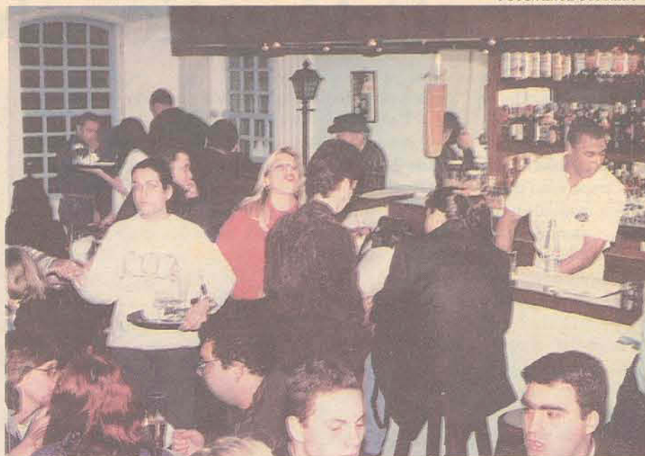
BAR PILEQUE: ponto de encontro da Praia do Meio