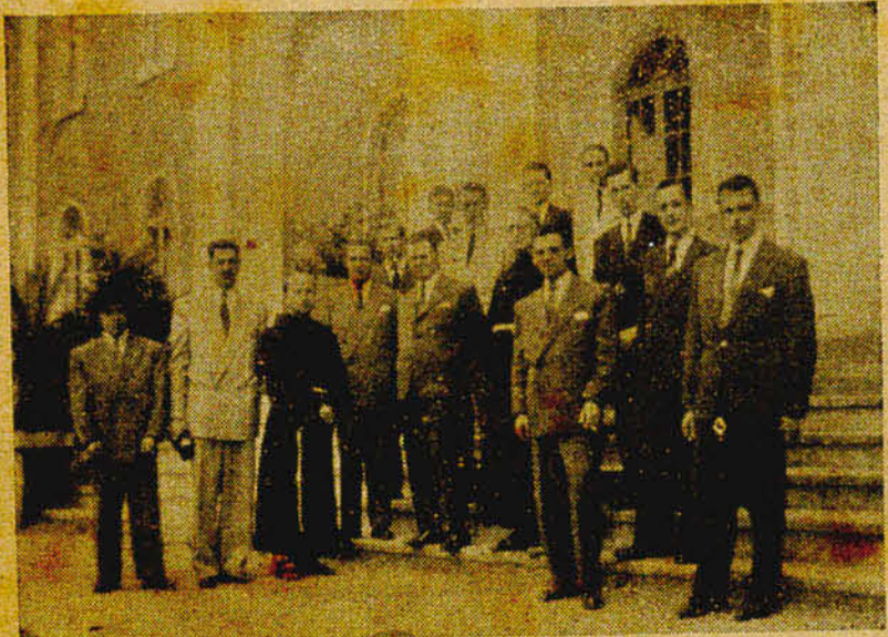
No Ginásio de Lajes, a nossa caravana foi acolhida com fidalga sinceridade. Após a visita às instalações os caravanistas disputaram uma brilhante partida de voleibol. No clichê, um grupo feito durante visita.

Os nove bachareis receberam, então, os cumprimentos e abraços de suas exmas. famílias, de amigos e admiradores. A essas felicitações "A Gazeta", muito cordialmente, apresenta as suas.