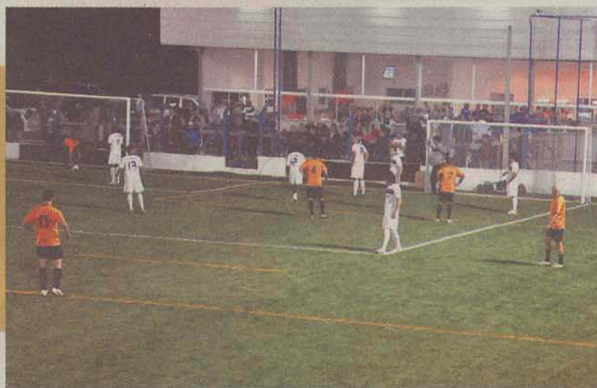
Detalhe do novo gramado e ao fundo a sede social da Floripa Soccer na noite de inauguração

Terminado o ato inaugural foram realizados os primeiros jogos no novo gramado, entre as equipes de futebol sete: Floripa Soccer 2x2 Beijo, CBN 1x4 Sede e Família 3x7 Juventus. Por fim o esperado clássico entre as equipes másteres de Avante 3x3 Avai.