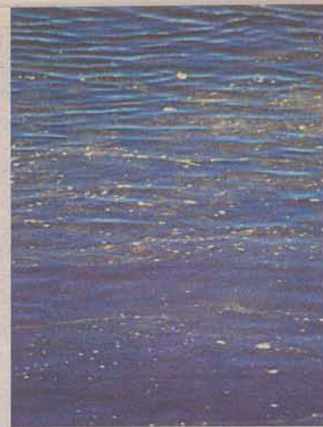
Óleos e graxas na superfície do rio Paraquara na chegada ao rio Ratones.

A Assembleia Legislativa vai discutir estes e outros problemas em duas audiências públicas já confirmadas, uma no Norte e outra no Sul da Ilha. A primeira acontece no dia 7 de agosto no clube Avante, em Santo Antônio de Lisboa, das 19 às 22 horas. A segunda acontece no Centro Comunitário do Rio Tavares, dia 4 de setembro, no mesmo horário.