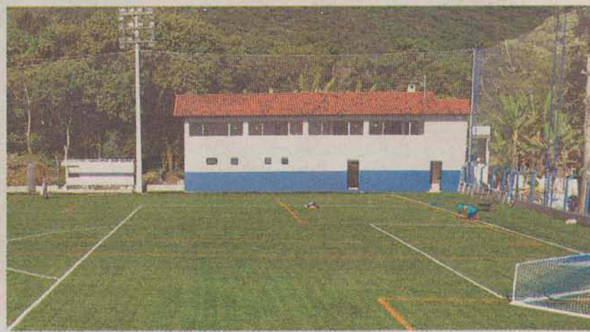
Antes (07/11/2011) e depois (07/06/2012)