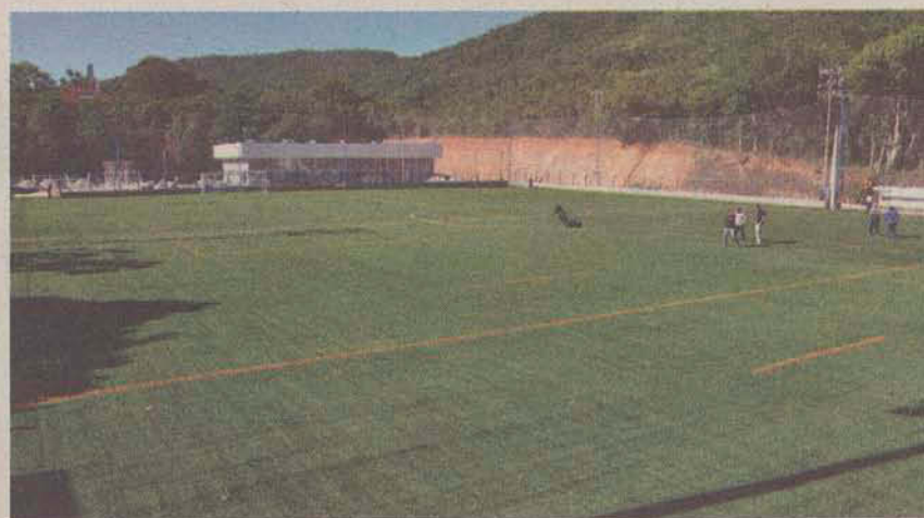
Antes (07/11/2011) e depois (07/06/2012)