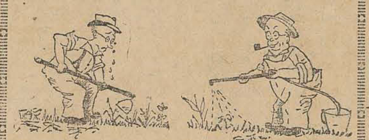
POR QUE CAPINAR... ASSIM E MAIS FACIL!

Citou a seguir um fato verificado há dias num estabelecimento de Caxias, quando um comerciante temeroso de um ajustamento em seu armazém fechou-o enquanto o povo já irritado tentou deprezá-lo, sendo impedido pelos mais sensatos. Finalizando disse: — “Caxias está pois prestes a explodir. O povo faminto irá ao saque como já demonstrou uma vez porque a fome não é divertimento de governantes insensatos, estúpidos ou indiferentes. A fome é fome. Faz revoluções. Sem plebiscito”.