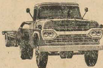
NÓVO SUPER F-600 CAVALO-MECÂNICO

Venha conhecê-la de perto no seu Revendedor Ford