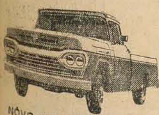
NÓVO SUPER F-100

A ÚNICA* linha completa de caminhões nacionais!