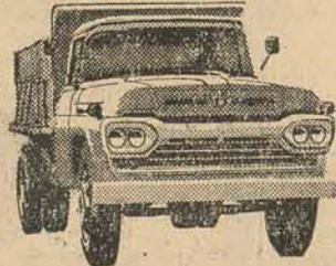
NÓVO SUPER F-600