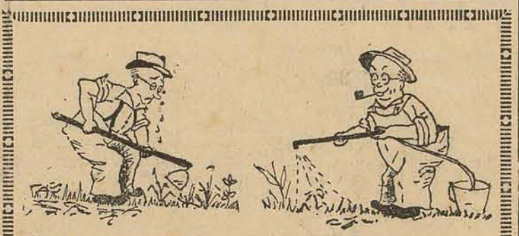
POR QUE CAPINAR... ASSIM É MAIS FACIL!

LONDRES, 27 (UPI) — A rádio de Amman afirmou que tropas leais ao presidente Nasser dominaram uma tentativa de levante de 400 soldados do exército egípcio para depor o governo do Cairo. O levante se iniciou quando os soldados rebeldes receberam ordens de partir para o Ymen.