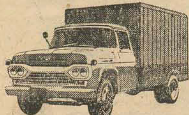
NÓVO SUPER F-350