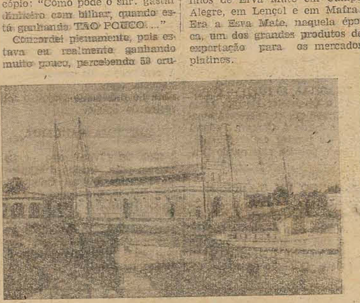
O primeiro Mercado Municipal, inaugurado em 1906

NOVA LISBOA, cidade africana em Angola, Colônia Portuguesa, comemorou neste ano o cinquentário de sua fundação que foi lembrado pelo Correio Angolense com um selo comemorativo, reproduzindo a estátua do general Norton de Matos, fundador da mesma cidade. O ESTADO DE KUWAIT, sul-tanab árabe no golfo pérsico, festejou o seu "dia nacional" de 1962 com a emissão de uma série de quatro selos, mostrando a sua bandeira em cores naturais. DE DE CANGURU chamamos uma flor australiana que está sendo mostrada em um novo selo postal lançado pelo Governo da Austrália no dia 10 de novembro corrente, para comemorar os sétimos jogos do Império britânico e sua comunidade de nações que se realizarão na cidade de Perth, de 22 de novembro a 10 de dezembro próximo vindouro.