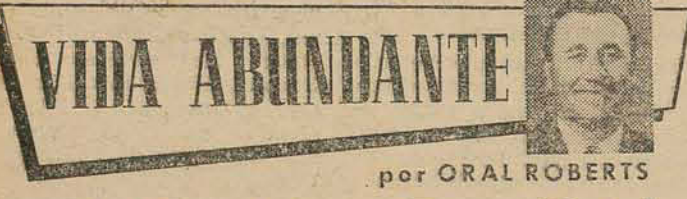
por ORAL ROBERTS

Porque senão, mesmo habilitadíssimo, mesmo habilíssimo, serão como loucos conduzido um cego e, com o tempo, perdendo-se na voragem e no perigo do perigo".