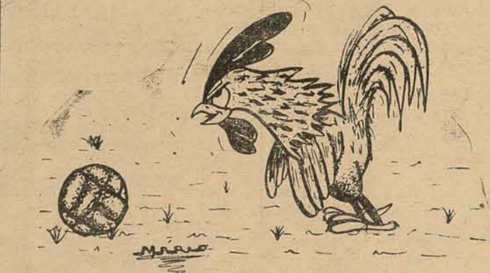
GALO — Estás pensativo, hein Pinguim? Isto é medo ou é falta de coragem?

Redator: - LUIZ MAURO CORRÊA Joinville, 21 de Outubro de 1962