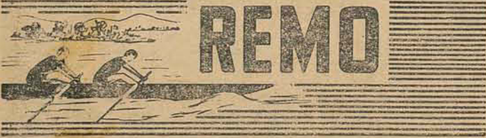
CACHOEIRA BRILHA NA GUANABARA

Amanhã a tarde será levada a efeito uma grandiosa domingueira, com participação do mesmo conjunto musical.