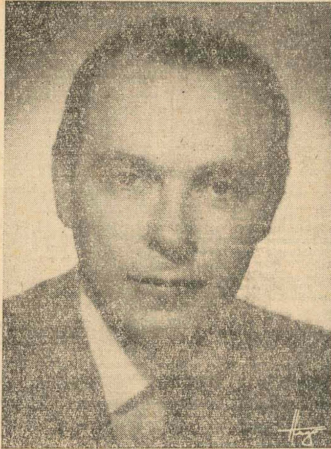
CANDIDATO DO PARTIDO TRABALHISTA BRASILEIRO e PARTIDO SOCIAL PROGRESSISTA