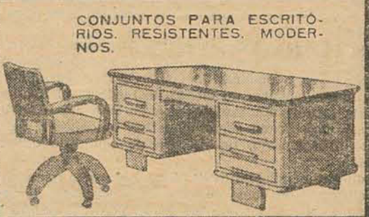
CONJUNTOS PARA ESCRITÓRIOS. RESISTENTES. MODERNOS.