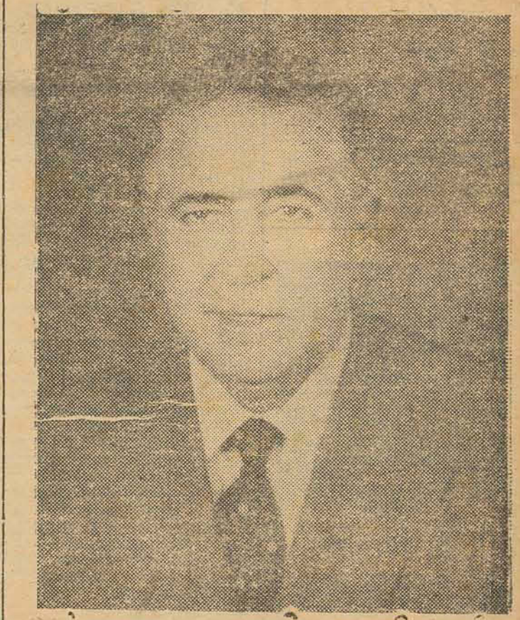
GOVERNADOR CELSO RAMOS

17 horas — São Francisco do Sul (jantar).