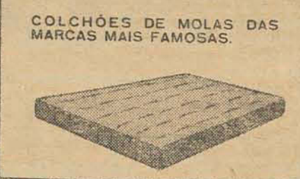
COLCHÕES DE MOLAS DAS MARCAS MAIS FAMOSAS.