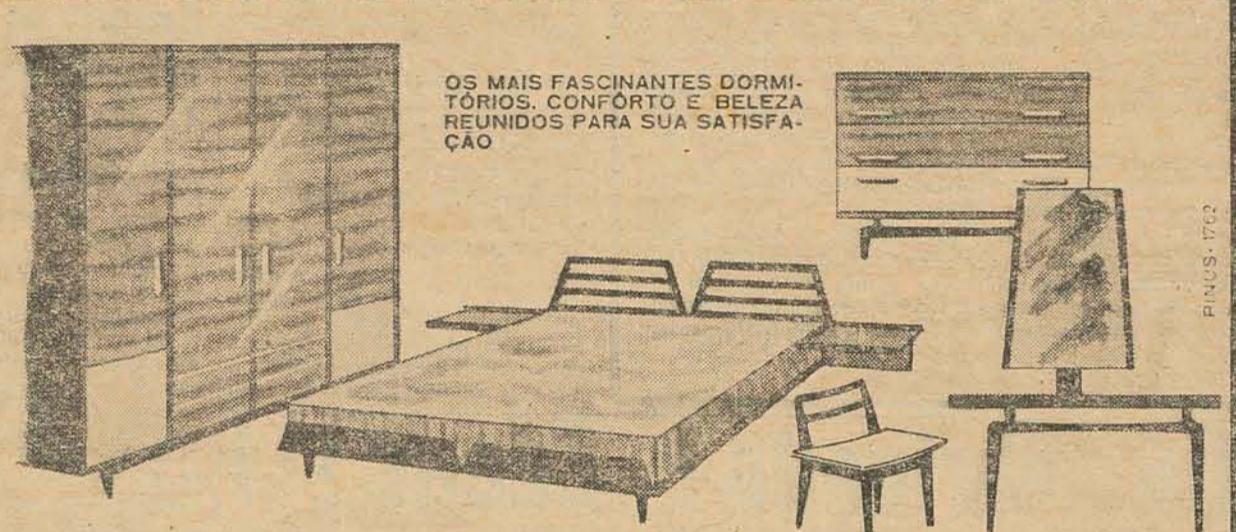
OS MAIS FASCINANTES DORMITÓRIOS. CONFORTO E BELEZA REUNIDOS PARA SUA SATISFAÇÃO