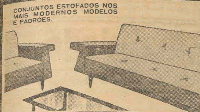
CONJUNTOS ESTOFADOS NOS MAIS MODERNOS MODELOS E PADRÕES.