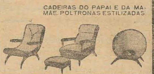
CADEIRAS DO PAPEI E DA MÃE. POLTRONAS ESTILIZADAS

A grande variedade de artigos selecionados vendidos pelas lojas de MÓVEIS CIMO, proporciona o conforto que V. procura! - E as condições de pagamento são sempre as mais favoráveis! - Aprecie! - Conheça de perto as tradicionais ofertas CIMO!