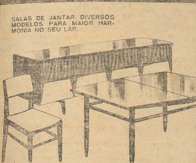
SALAS DE JANTAR. DIVERSOS MODELOS PARA MAIOR HARMONIA NO SEU LAR.