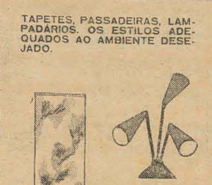
TAPETES, PASSADEIRAS, LAMPADÁRIOS. OS ESTILOS ADEQUADOS AO AMBIENTE DESEJADO.

A grande variedade de artigos selecionados vendidos pelas lojas de MÓVEIS CIMO, proporciona o conforto que V. procura! - E as condições de pagamento são sempre as mais favoráveis! - Aprecie! - Conheça de perto as tradicionais ofertas CIMO!