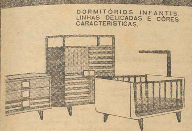
DORMITÓRIOS INFANTIS. LINHAS DELICADAS E CORES CARACTERÍSTICAS.