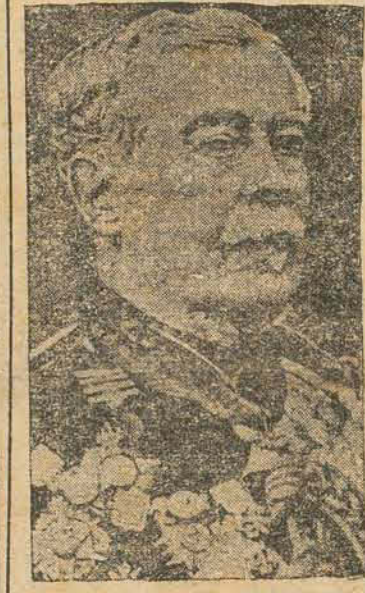
DUQUE DE CAXIAS — trono do Exército Brasileiro, em cerimônia a realizar-se no Estádio Ernesto Schlemm Sobrinho, perante à Bandeira Nacional, 466 recrutas do 13º BC.

"Incorporando-me ao Exército Brasileiro, prometo cumprir rigorosamente, as ordens das autoridades a que estiver subordinado, respeitar meus superiores hierárquicos, tratar com afeição os irmãos de arma e com bondade os subordinados e dedicar-me inteiramente ao serviço da Pátria, cuja honra, integridade e instituições defenderei com o sacrifício da própria vida".