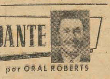
por ORAL ROBERTS

FARMACEUTICO WOLFGANG O. F. KRESS Cap. XV