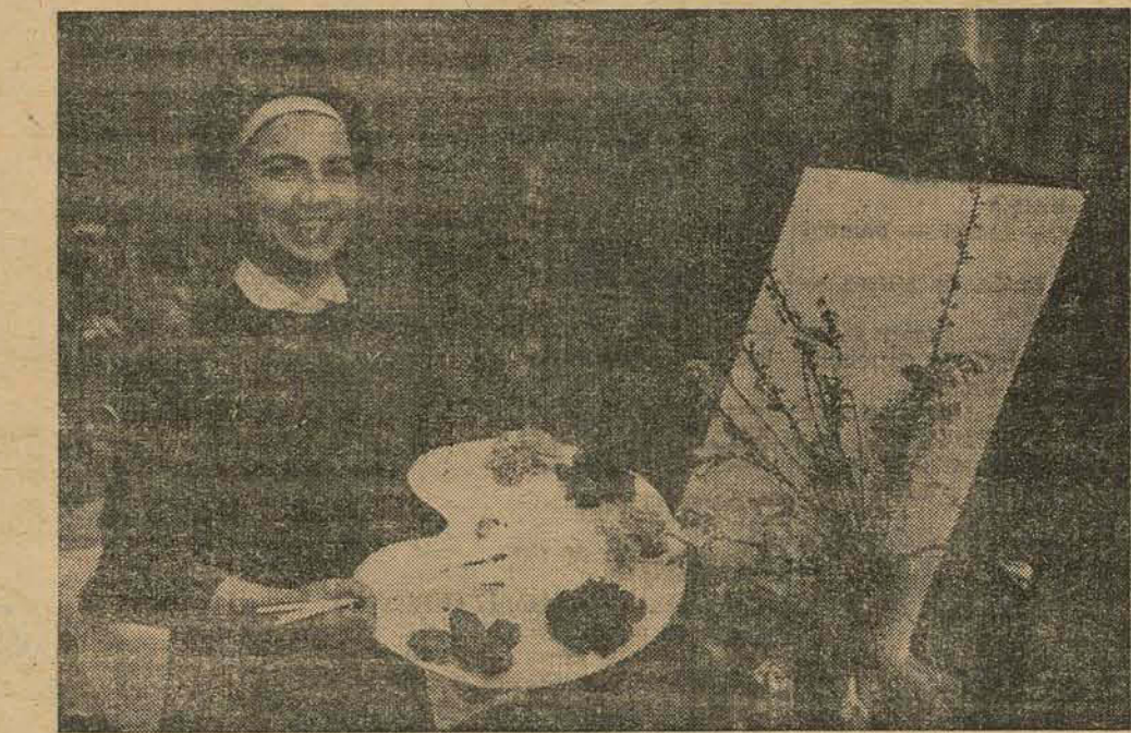
Na vida do povo alemão as flores têm papel importante. Visitando a República Federal Alemã, nota-se logo a grande quantidade de floristas, cujo número aumentou nos últimos 10 anos, de 4.000 para 10.000. Anualmente, 2.000 novos aprendizes de floristas entram para as escolas profissionais onde são mantidos

"Quando Setembro Vier" — (Come Setembro) — Sem dúvida alguma, Raoul Walsh como produtor, foi quem compreendeu melhor a Lollobrigida americana. A estrela italiana não tem sido feliz em Hollywood e caiu de tal forma, que os fãs já nem mais pensam nela como rival de Sofia Loren. Mas Walsh resolveu dar-lhe uma pequena chance, e o filme aí está, com Loló no papel de italiana, falando inglês e sua língua nativa, sem perder a gesticulação particular, e podendo se exibir em um vestido para cada cena, como se estivesse em desfile de modas. O fato é que Lollobrigida está ainda distante daquela que se exibia nos filmes italianos, mas apareceu pelo menos mais desembaraçada, descomplexada, a ponto de ter cenas de amor com Rock Hudson que muita beijoqueira americana não saberia mostrar tão bem. Rock Hudson que