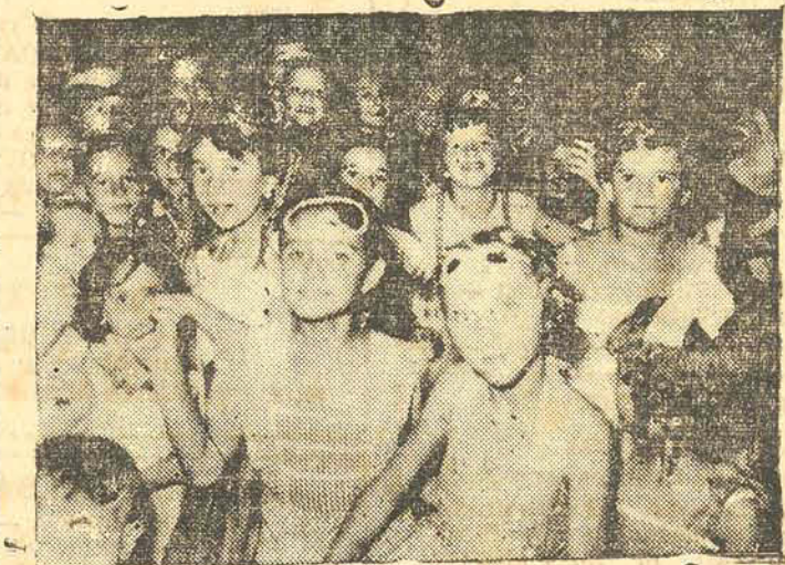
Flagrante de um dos animados bailes infantis carnavalescos da SAC

adado à tarde, numa vespéral promovida pela Radiodifusora de Joinville, no Palácio dos Esportes. Duas pistas de danças foram improvisadas naquela casa de esportes, uma para crianças e outra para os adultos, tendo a vespéral carna-