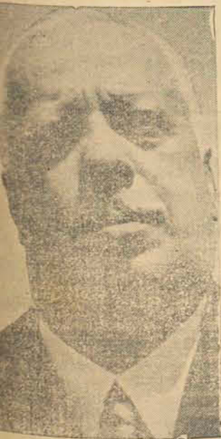
NOTÁVEL CARREIRA POLITICA

SALVADOR, 30 (Transp) — «A política brasileira perdeu uma das suas maiores sumidades com o falecimento de Otávio Mangabeira», declarou ontem o Governador Juracy Magalhães Mangabeira, declarando o conhecimento da morte no Rio de Janeiro do notável brasileiro. E acrescentou: — «A grande vida deste homem não faltou nem o sacrifício da prisão e do exílio, desenvolvendo-se sempre na inspiração de bem servir o público».