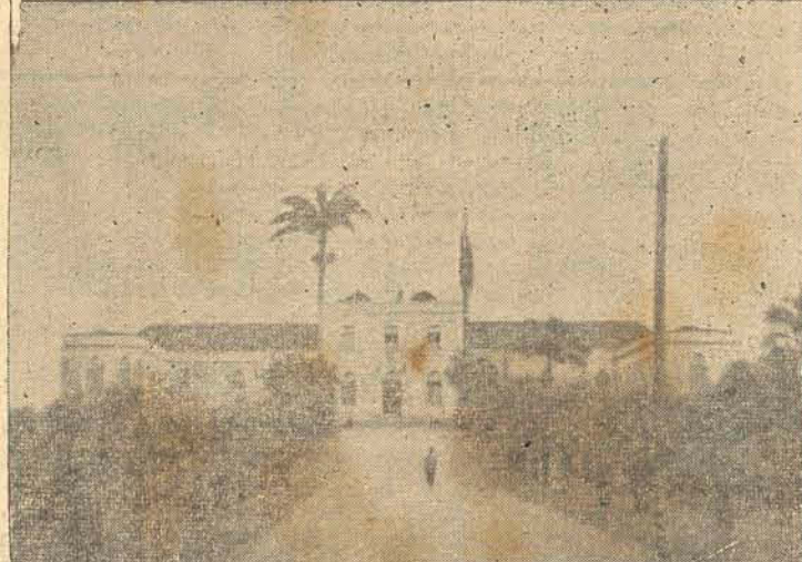
Aspecto da fachada do HOSPITAL SAO JOSE