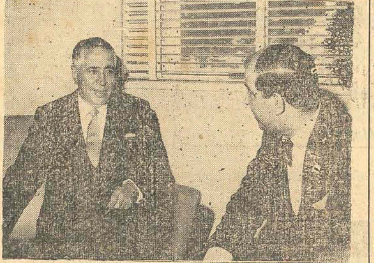
O governador eleito sr. Celso Ramos falando ao jornalista

Florianópolis, 10 (Do Correspondente) — Quando, ao segundo dia das apurações do pleito de 3 de outubro, em companhia de outros representantes da imprensa, conseguimos ser atendidos pelo sr. Celso Ramos, cuja vitória se anunciava, o ilustre candidato não quis fazer declarações, limitando-se a agradecer a natural pressa dos homens de jornal e prometendo fazer quando a decisão popular já se positivasse inequívoca. Entem, quando esse momento não deixava mais dúvidas quanto à grande vitória, o sr. Celso Ramos colocou-se à disposição da nossa curiosidade em ouvi-lo, na sede do seu Partido, em hora especialmente marcada. O diálogo foi o que segue: REPORTER: — Como recebeu os resultados eleitorais que o elegeram? SR. CELSO RAMOS: — Homem maduro, trabalho pela experiência, costume meditar sobre tudo quanto me acontece. Direi, assim, aos meus cares jornalistas, que fui humano em receber com o maior júbilo a prova de que o povo catarinense resol-