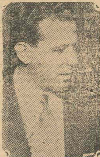
Sr. João Goulart