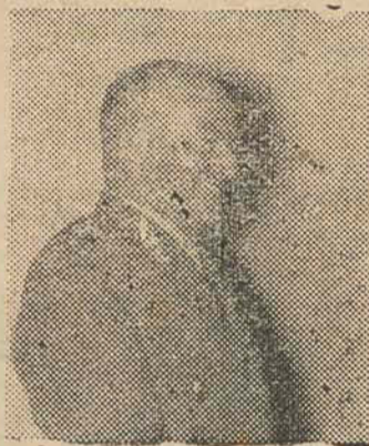
Marechal Teixeira Lott