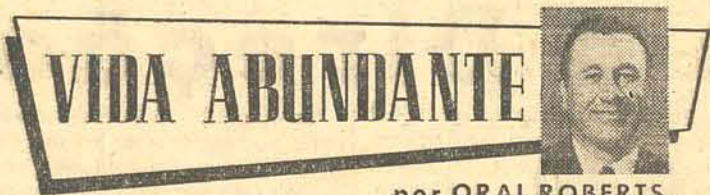
por ORAL ROBERTS

Os empréstimos serão contratados com bancos, Caixas Econômicas ou Institutos de Previdência, com garantia do Poder Executivo, em nome da União, cabendo ao Presidente da República comunicar as providências tomadas ao Congresso Nacional.