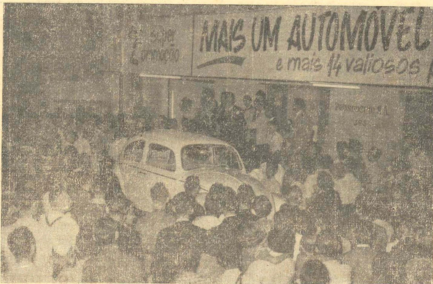
Cercado de uma verdadeira multidão de populares o feliz ganhador do primeiro prêmio no Concurso Prosdocimo recebe o seu Volkswagen

E sem dúvida, depois do primeiro sorteio, serão muitos os que se habilitarão a mais esse lance da roda da fortuna, pois de fato vale a pena.