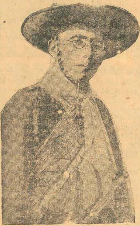
O famigerado bandoleiro Lampeão