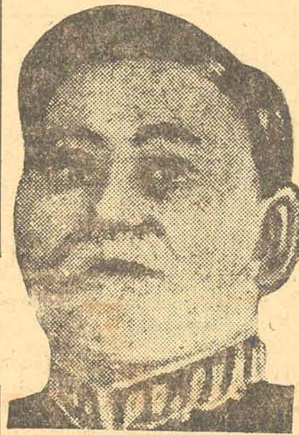
General Nepomuceno Costa

Bello Horizonte, «A Noticia» — Foi festejadissima pelo povo mineiro, a caravana do Partido Nacional Democratico, chefiada pelo eminente republicano dr. Assis Brasil.