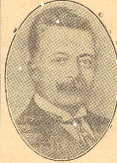
O sr. Epitacio Pessoa, o invalido da Patria.

Não ha ainda tres mezes, os governos do Brasil e da França firmaram um accordo para o fim de ser submettida ao arbitramento da Corte de Haya a questão do pagamento em ouro dos juros de empréstimos contrahidos naquelle segundo paiz, antes da guerra.