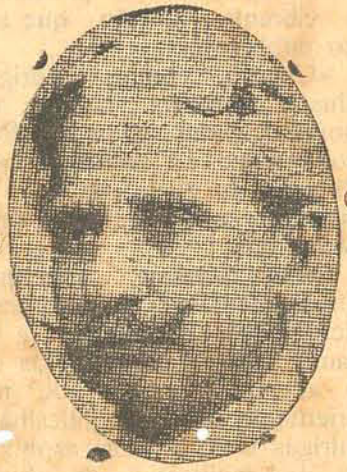
Assis Brasil, o evangelizador dos pampas

Rio, 23 (Havas) — A caravana do Partido Democratico, chefiada pelo deputado gaúcho Assis Brasil, segue amanhã para Bello Horizonte, tomando parte todos os deputados da esquerda.