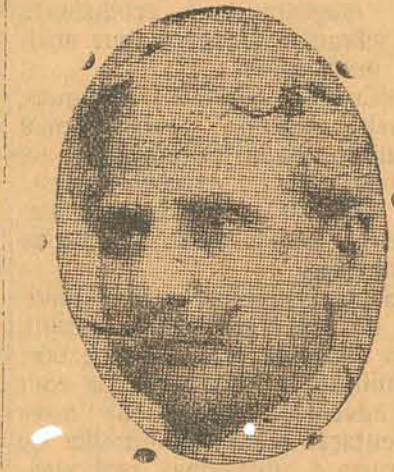
Assis Brasil, o evangelizador dos pampas

Rio, 23 (Havas) — A caravana do Partido Democratico, chefiada pelo deputado gaúcho Assis Brasil, segue amanhã para Bello Horizonte, tomando parte todos os deputados da esquerda.