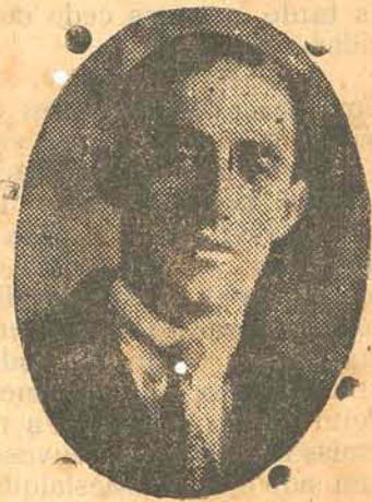
Cabanas, o heroe de Formigas.

O senador Irineu insurgindo-se contra essa resolução, declarou que um projecto apoiado por cinco senadores tem de seguir os transmisses regimentaes. Trava-se a esse respeito longa discussão entre o senador carioca e o