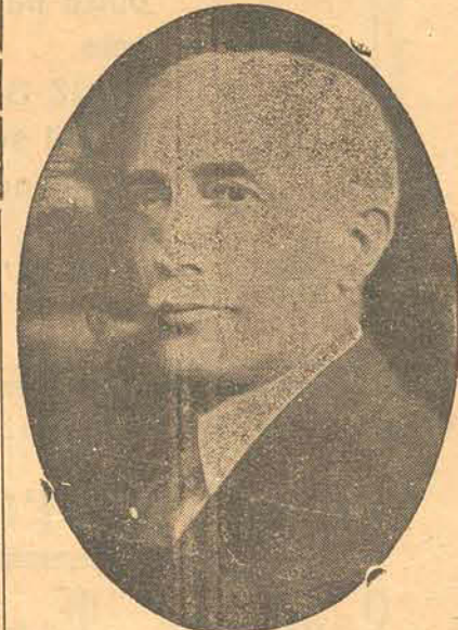
O presidente Antonio Carlos

Um sr, alto gordo, aproximando-se do auto da presidencia gritou: «Viva o futuro presidente do Brasil!» Como do automovel alguém lhe agradecesse a amavel propheta, o cavalheiro enthusiasma-