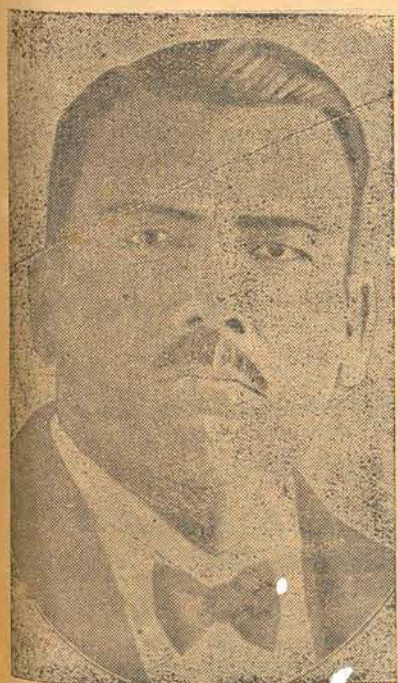
O presidente Calles, do Mexico

O QUE O ACTUAL GOVERNO PENSA ARRECADAR ATÉ EXPIRAR O SEU MANDATO