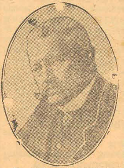
Marechal von Hindenburg

A republica allemã, no ultimo Domingo, 2 de Outubro, cessou o seu honrado trabalho de reconstrução, para homenagear divididamente o seu presidente, o marechal Paulo von Hindenburg, que completou entre as maiores satisfações de jubilo de todos os seus governados, a idade de 80 annos.