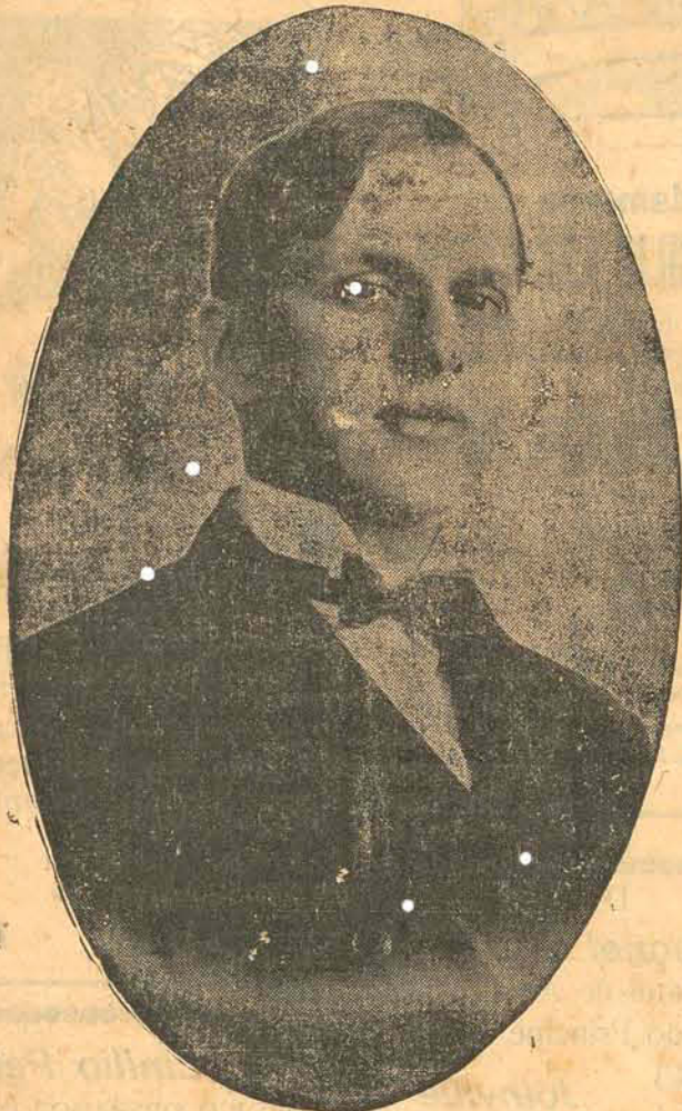
DR. ADOLPHO KONDER

Completa-se hoje o primeiro anno de governo do exmo. sr. dr. Adolpho Konder. Um anno faz que o destino de nosso Estado foi entregue ás mãos de um moço cheio desse entusiasmo da nova geração brasileira, cheio desse ardor peculiar aos verdadeiros e inhabitáveis dirigentes de povos laboriosos.