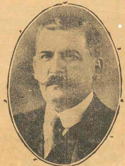
Dr. Wenceslau Braz

Em torno desse facto, diz-se que os elementos combativos da politica do Estado fizeram sentir ao presidente Antonio Carlos que Minas não pôde continuar a receber platonicamente as successivas humilhações que lhe têm sido impostas. Prevê-se aqui, para bre-