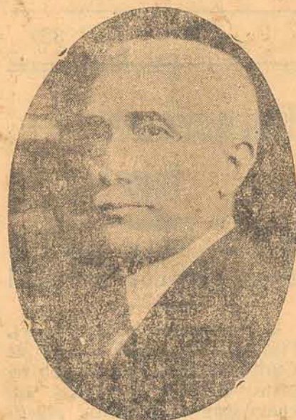
Presidente Antonio Carlos, sob cujos auspícios se realizou o Primeiro Congresso de Instrução Primária

PALAVRAS DO DR. ANTONIO CARLOS SOBRE A ESCOLA MODERNA