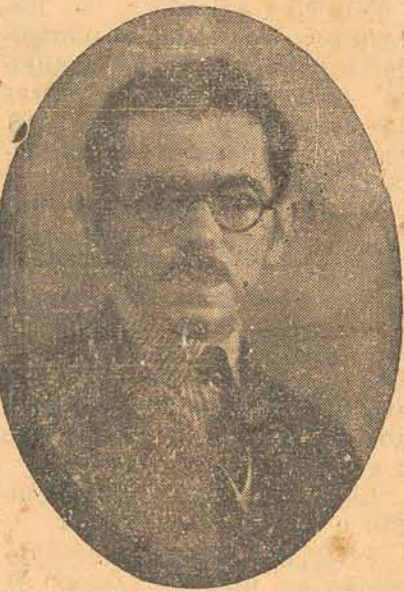
Dr. Francisco Campos, secretario do Interior, organizador do Primeiro Congresso.

«A escola, na concepção contemporanea, e consideradas as imposições do meio social nos tempos presentes, não pode cogitar apenas, em termos summarios, da cultura intellectual; tem de caber-lhe, em grande parte, a efficiente missão de revigorar o caracter da juventude, proporcionar-lhe robustez physica e formar o homem para os embates da vida, ensinando-lhe a confiar mais no proprio valor que no amparo do Estado ou da collectividade, afeição-o a disciplina do trabalho, incutindo-lhe amor á ordem, o respeito ás leis, os principios de honra, de dignidade e de patriotismo.