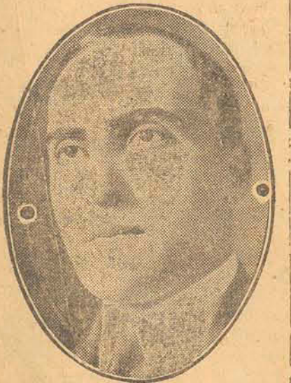
Dr. Mauricio de Lacerda

Era anciosamente esperado o livro de Mauricio de Lacerda, «Historia de uma covardia». Apareceu no Rio o desejado volume. São, cerca de quinhentas paginas que desde logo attestam o temperamento do jornalista e tribuno, que se tem batido com ardor ininterruptamente pelas liberdades publicas.