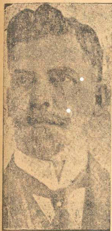
Dr. Washington Luis, presidente da Republica.

A situação financeira do Brasil é infelizmente muito desagradavel