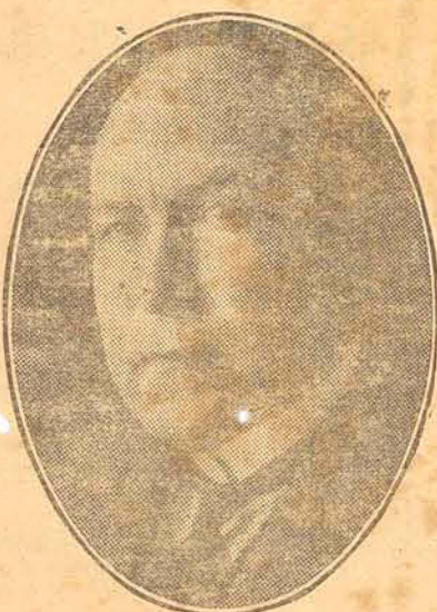
Sr. J. J. Seabra, que vae agitar o Senado, por estes dias

inelegibilidade do ex-ministro do quadriennio Bernardes, por ser irmão do governador da Bahia. Miguel Calmon representa uma situação arbitraria que calca aos pés os direitos mais lidimos do povo; que falsifica actas, que assalta collegios eleitoraes, que insulta juizes para perturbar os trabalhos de juntas apuradoras; representa o governo bahiano, prepotente e anarchico. E representa tambem a politica iname e sanguinaria do bernardismo; a politica que aruinou o paiz e enxovalhou as suas instituições. Ao contrario disso, o que representa Seabra? Seabra representa as tradições do nosso li-