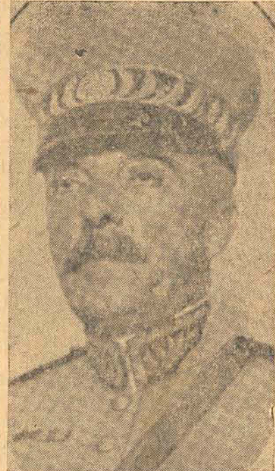
O general Sezefredo Passos, ministro da Guerra

RIO, 11 — O sr. ministro da Guerra solicitou do Tribunal de Contas a distribuição ás Delegacias Fiscaes do Paraná, Santa Catharina e Rio Grande, dois creditos de 342:000$ 297:000$ e 3:600$ destinados ás despesas de pagamento das vantagens dos Tenentes em commissão que servem nos dous primeiros Estados e aos vencimentos de contra-mestre do sr. Humberto Camina, addido ao Arsenal de Guerra de Porto Alegre.