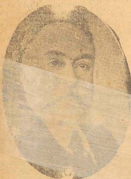
Senador Paulo de Frontin