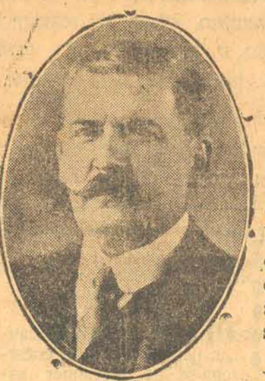
Sr. Wenceslau Braz

BELLO HORIZONTE, 27 — (A Noticia) Sem a divida autorisação do sr. Wenceslau Braz, collocaram o seu nome no boletim do Partido Republicano Mineiro, indicando os candidatos para a renovação da camara e do terço do senado. O ex-presidente da Republico logo que teve conhecimento do occorrido declarou que não autorizou a ninguem a utilizar-se de sua assignatura. As declarações do sr. Wenceslau Braz desorientou o situacionismo mineiro.