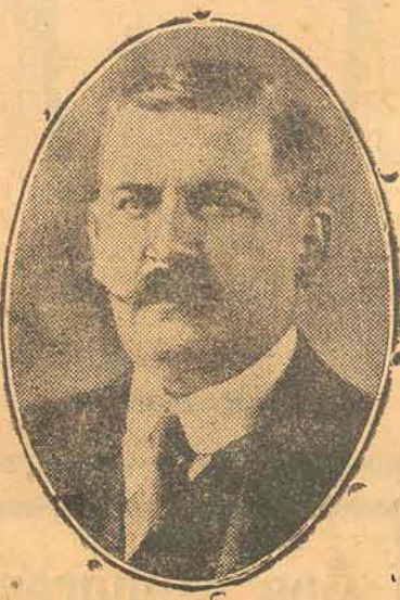
Sr. Wenceslau Braz

BELLO HORIZONTE, 21 — O Sr. Wenceslau Braz, representado pelo senador Bueno Paiva, fez constar na acta de reunião da commissão hoje, ser seu candidato á senatoria o sr. Afranio de Mello Franco em quem votou.