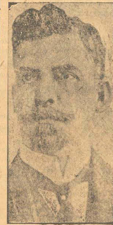
O sr. Washington Luis

S. Excia. apieda-se dos perseguidos politicos