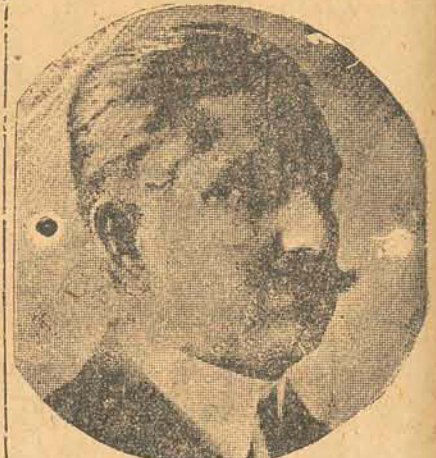
O sr. Estacio Coimbra

Parece que a situação é resultante do convenio estabelecido entre os srs. Estacio Coimbra, governador de Pernambuco e Costa Rego, de Alagoas.