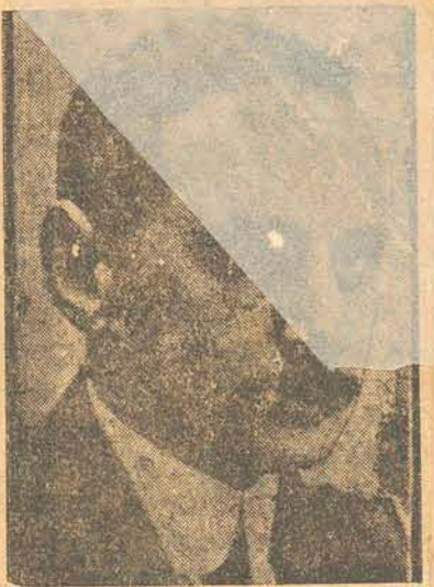
O escriptor João de Barros

LISBOA, 14 (A Noticia) Sabe-se nos circulos literarios d'aqui que o illustre escriptor patricio João de Barros pretende brevemente visitar o Rio de Janeiro e outras cidades importantes do Brasil.