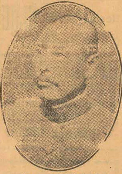
O marechal Wu-Pei-Fu

Em Kiu-Kiang querem matar os estrangeiros á fome