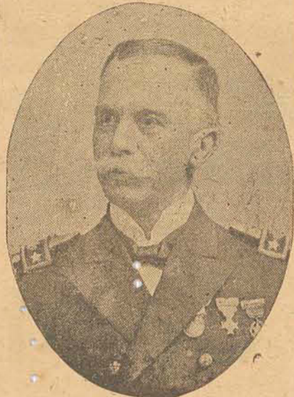
Almirante Alexandrino de Alencar, ministro da Marinha.

OS DEZ MIL CONTOS DE S. PAULO SERÃO, DENTRO EM POUCO, UMA REALIDADE