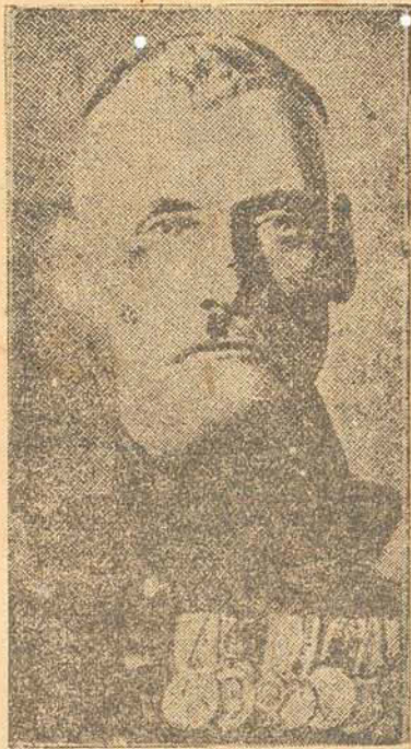
O príncipe Rupprecht

Rio, 20 (A Noticia) — Telegrammas procedentes de Berlin, informam-nos de que na Baviera os politicos continuam a agir animadamente, com o fim de collocar no throno o príncipe Rupprecht.