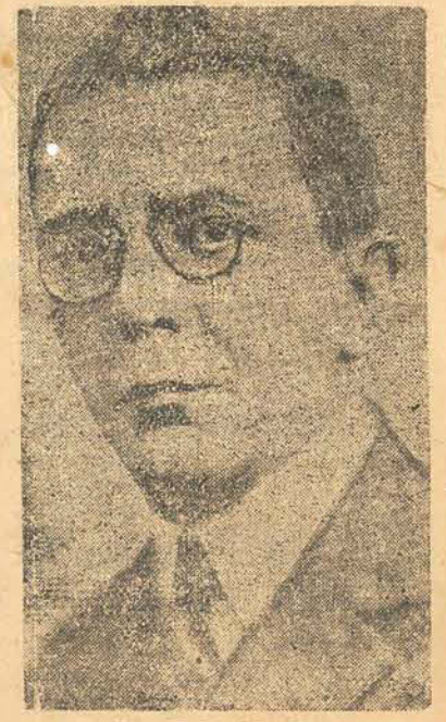
Dr. Felix Pacheco

RIO, 15 (A Noticia) — O sr. ministro Felix Pacheco, continúa protestando a respeito de uma carta que os srs. Bloek & Rosenthal dirigiram ao nosso addido commercial em Berlim. O ministro da Guerra communicou ao seu collega da pasta das Relações Exteriores que a referida firma foi mal informada, porquanto não foi mandada commissão alguma do Brasil para a Alemanha comprar armamento conforme lhe declarou a referida firma.