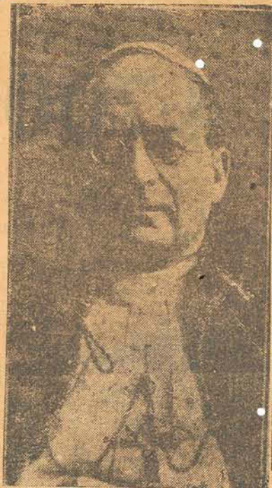
O Papa Pio XI

Rio, 17 — Dizem que o ministro das relações exteriores da Argentina enviou uma nova nota ao Vaticano com relação a uma publicação feita pelo «Observador Romano» organ official do Vaticano, que afirma que a Argentina está em completa ruina moral em consequencia da invasão dos anglicanos.