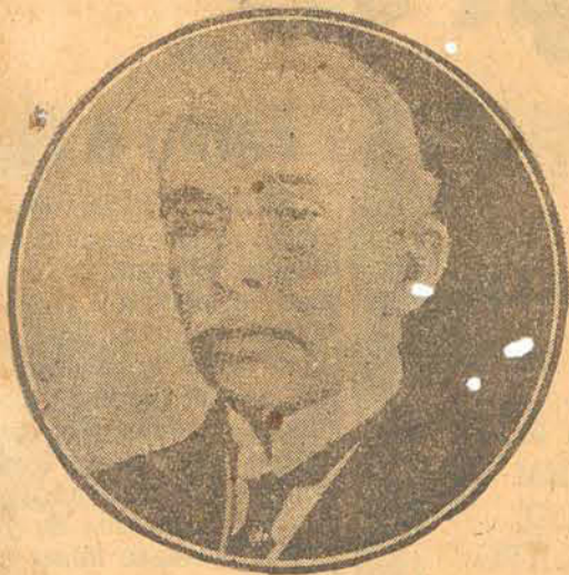
O Senador Lauro Sodré

Rio, 29 — Mais uma sessão animada realizou-se sabbado no Senado, ouvindo-se na hora do expediente dois empolgantes discursos de combate, que foram pronunciados pelos senadores Lauro Sodré e Antonio Muniz.