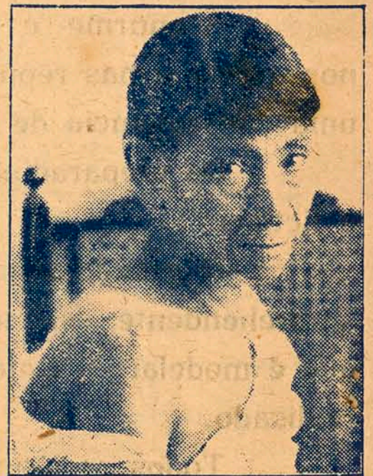
Depois do tratamento pelo LUESOL (Cicatrisação completa !)

O LUESOL é um preparado scientifico de grande valor, e como tal foi submettido a experiencias com grande successo nos principaes hospitales civis e militares, casas de saude e sanatorios do Estado do Rio Grande do Sul, e na 18ª enfermaria do grande Hospital de Misericordia do Rio de Janeiro, onde realisou curas admiraveis, tendo merecido dos sephoras medicos os mais exponents e honrosos pareceres.