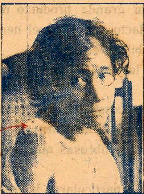
Antes do tratamento (Horriavel aspecto)