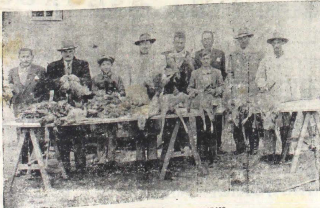
Caça abundante em preparo