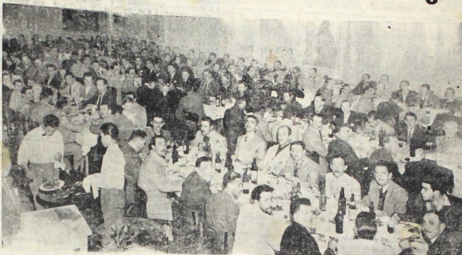
Aspecto parcial do grande banquete