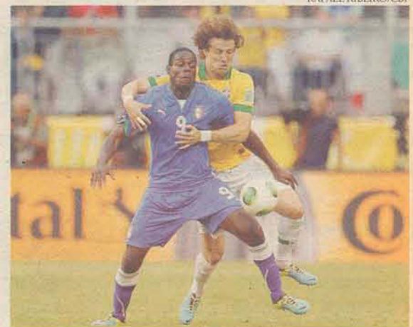
RECURSO Segundo Julio Cesar, faltas 'sem violência' fazem parte da estratégia de Felipão