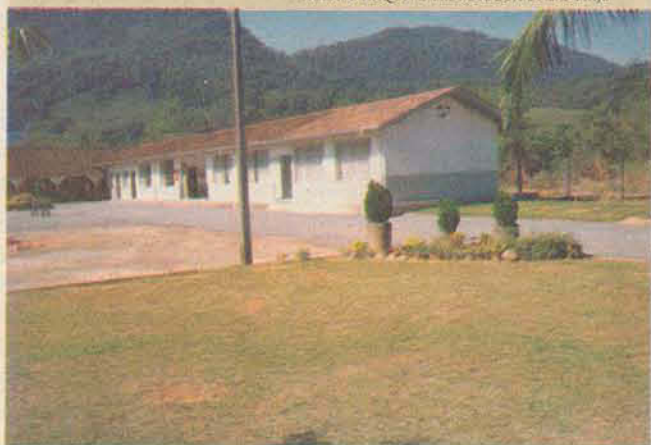
A Escola Jaraguá 84, em 2001