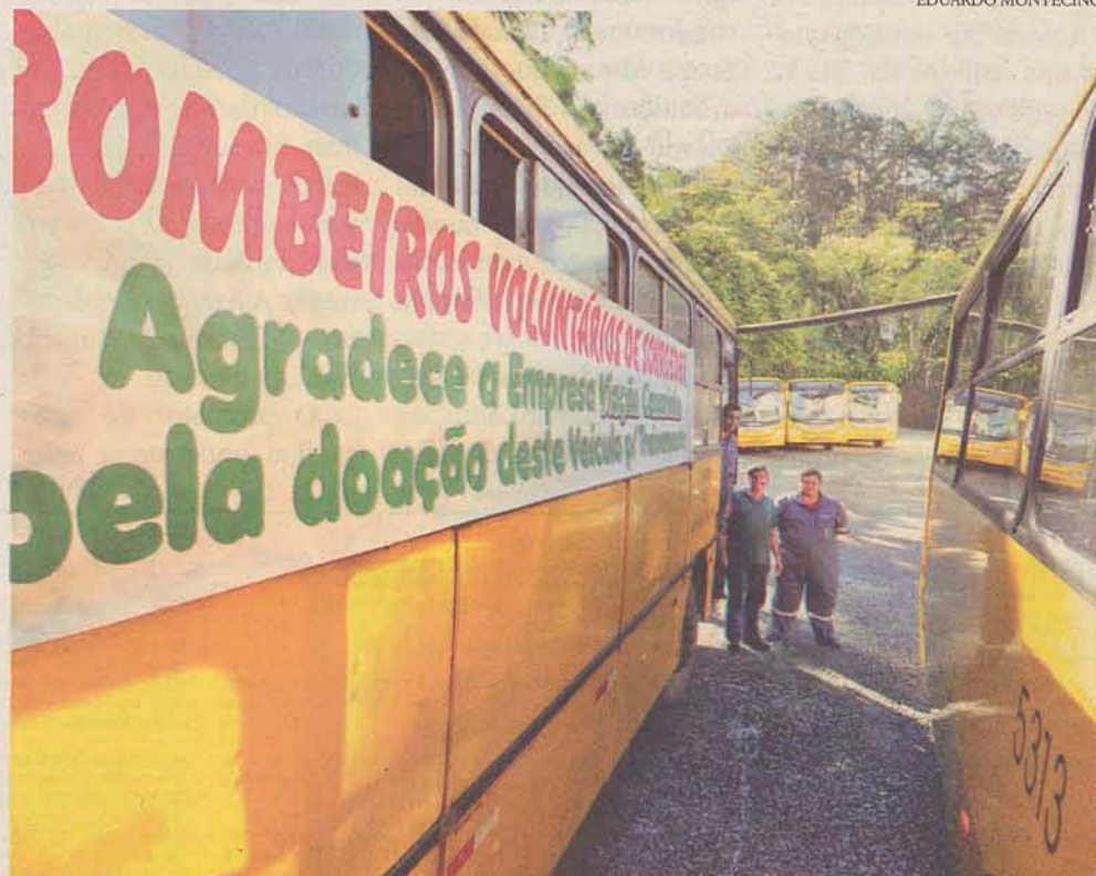
APOIO Veículo não tem mais o motor, mas será usado para a simulação de resgate