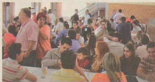
Mais de 200 pessoas prestigiaram o evento