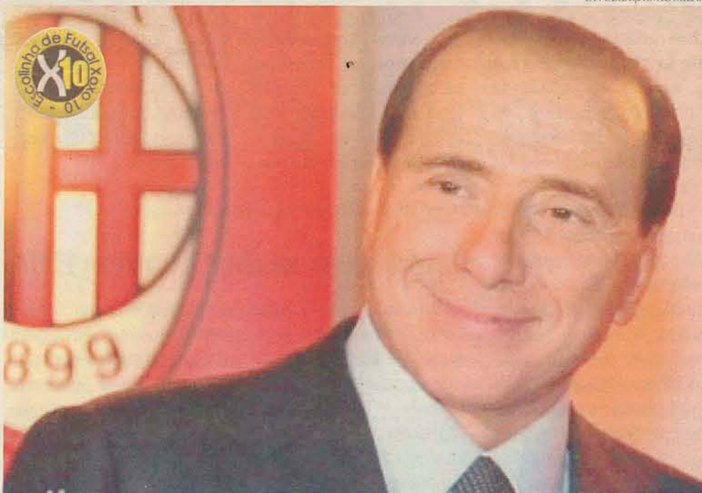
PODEROSO Além de presidente do Milan, Berlusconi foi primeiro ministro da Itália