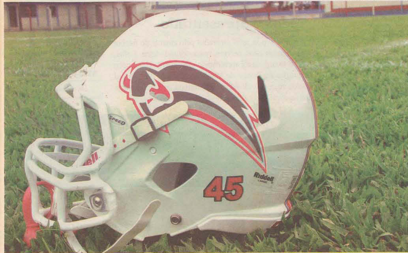
AMARGO Derrota por 71 a 0 não estava nos planos dos corupaenses, que souberam aceitar o resultado