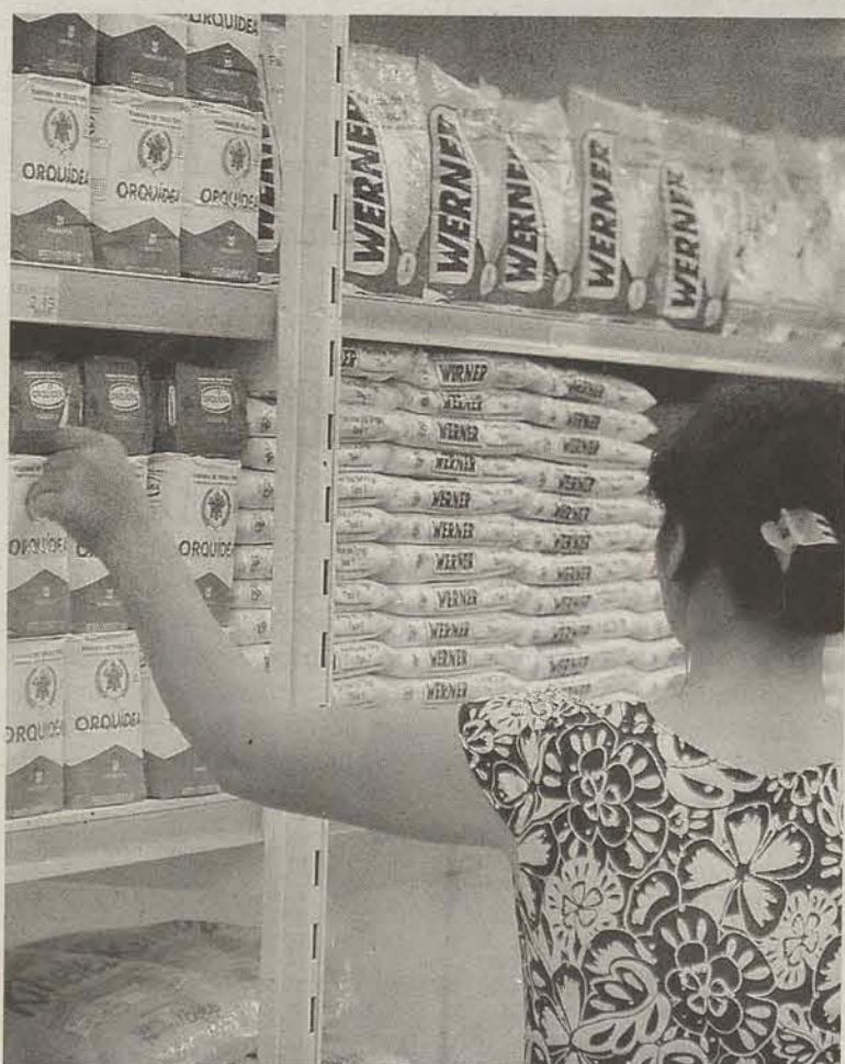
Brasileiro começa a deixar alguns produtos nas prateleiras do supermercado

De acordo com o IBGE, o resultado indica uma virtual estabilidade na atividade industrial. De janeiro a abril de 2008, a indústria teve incremento de 7,3% na produção, em relação ao mesmo período em 2007. Neste período, segundo o IBGE, houve crescimento em 20 dos 27 segmentos pesquisados. Na comparação com abril do ano passado, foi verificada alta de 10,1%, a maior taxa desde outubro de 2007. No acumulado dos últimos 12 meses, a produção industrial tem crescimento de 7%.