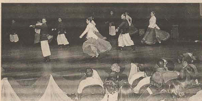
Laços da Tradição é um dos grupos mais requisitados da região

O grupo dança músicas típicas de diversas etnias como argentinas, bolivianas e as tradicionalistas da cultura gaúcha. A entidade prepara coreografias de danças em diferentes estilos, com números de sapateado e boleadeiras. O objetivo principal é divulgar e resgatar a cultura. Para o baile de aniversário o ingresso será R$ 10. Outras informações pelo telefone 3375-2210.