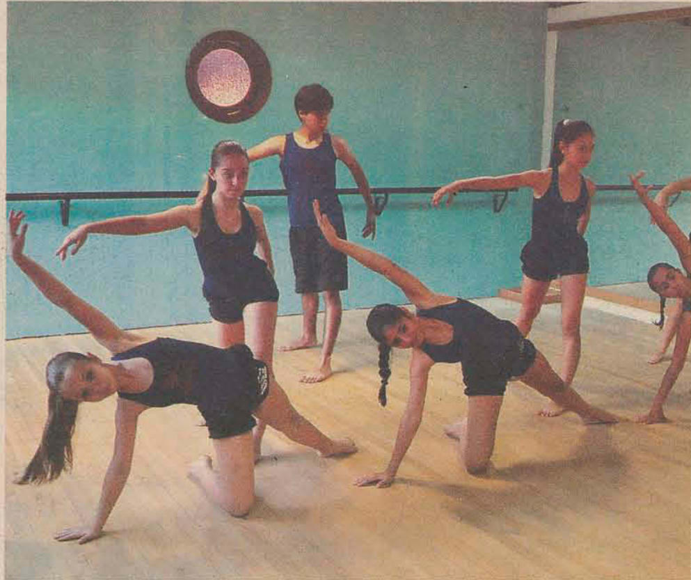
Meninos vão apresentar trabalho do coreógrafo Wald Oliveira no Festival de Dança de Joinville