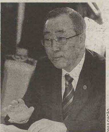
Ban pede produção duplicada até 2030

Ki-moon pede ajuste de tarifas para o livre comércio e solução da Rodada Doha