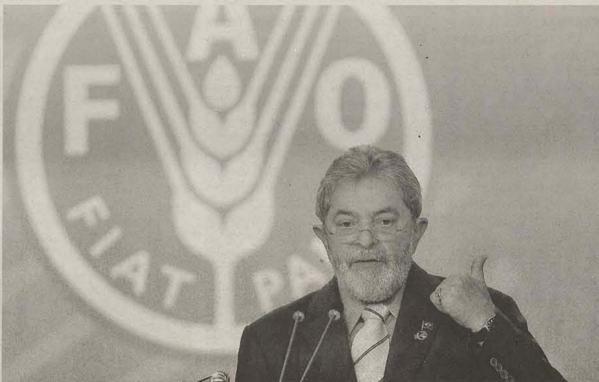
Presidente Lula propõe globalização da agricultura, como foi realizada na produção industrial

O presidente considera a crise atual uma crise de dis-