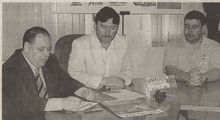
Coletiva de imprensa para divulgar evento aconteceu na manhã de ontem

O ingresso será um quilo de alimento não perecível e os postos de troca estarão relacionadas no site www.gospelfest.biz .