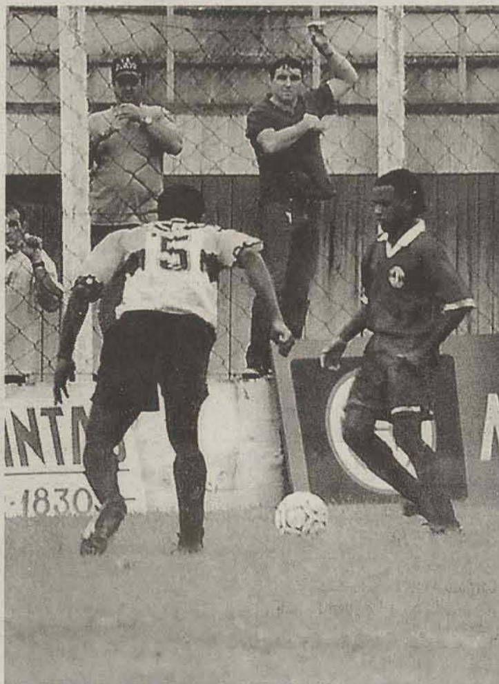
Biro-Biro em 1995, em confronto contra o Criciúma pelo Estadual

Biro conta que o time de 1993 ficou em 5º no Campeonato Catarinense e conquistou a Copa da Integração (que hoje é conhecida como Copa Santa Catarina). Em 1995 o Tricolor tinha nada mais nada menos que Celso Roth no comando a boa fase seguiu até meados de 1996 quando mudou a diretoria.