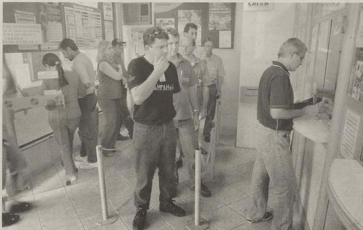
Ilha da Figueira, que conta com 15 mil habitantes, terá a primeira casa lotérica, depois de muita reivindicação