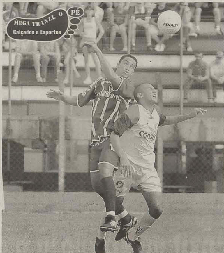
Juventus e Joinville estarão juntos na Divisão Especial do Catarinense