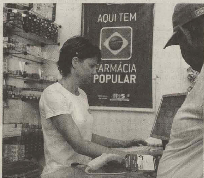
Farmácia do Sindicato também é credenciada ao programa Federal