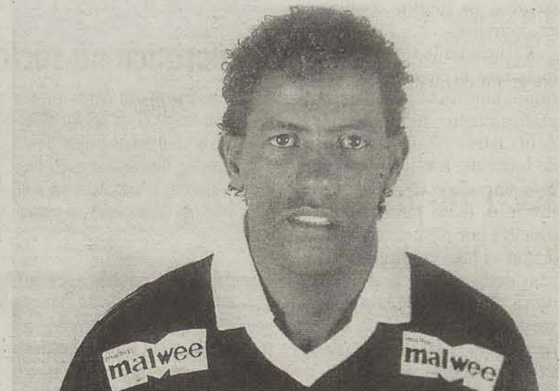
Jogador relembra dos tempos áureos do tricolor, onde jogou três anos