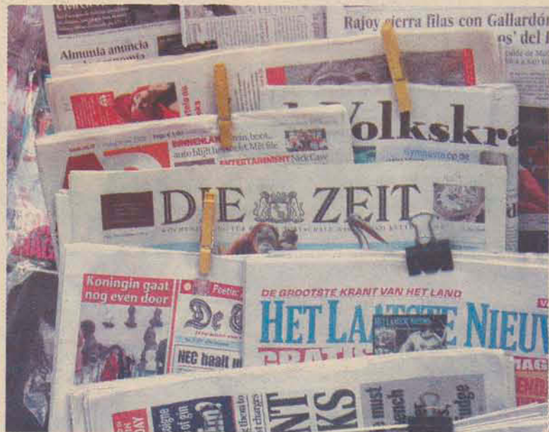
Em 2007, circulação de jornais aumentou 2,57% no mundo todo

O relatório anual da WAN sobre o mercado foi divulgado essa semana no 61º Congresso Mundial de Jornais, com 113 países, em Göteborg, Suécia.