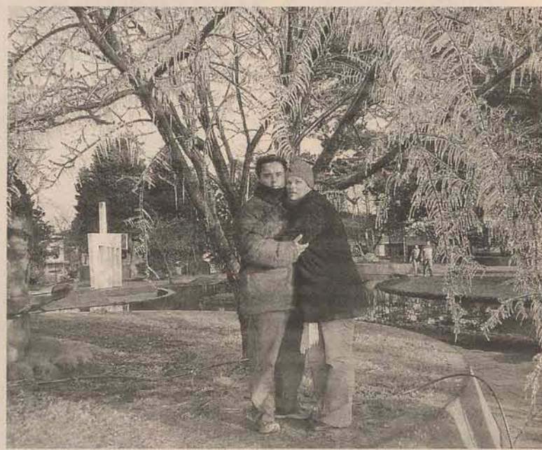
Milhares de turistas aproveitam inverno para conhecer São Joaquim

A melhor infra-estrutura turística de São Joaquim está nas fazendas para turismo rural, mas na cidade também há bons hotéis, com calefação ou lareira, adaptados para o frio rigoroso do inverno. Os restaurantes típicos servem comida caseira e muito saborosa.