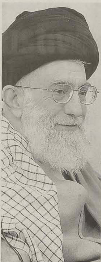
Khamenei defende programa