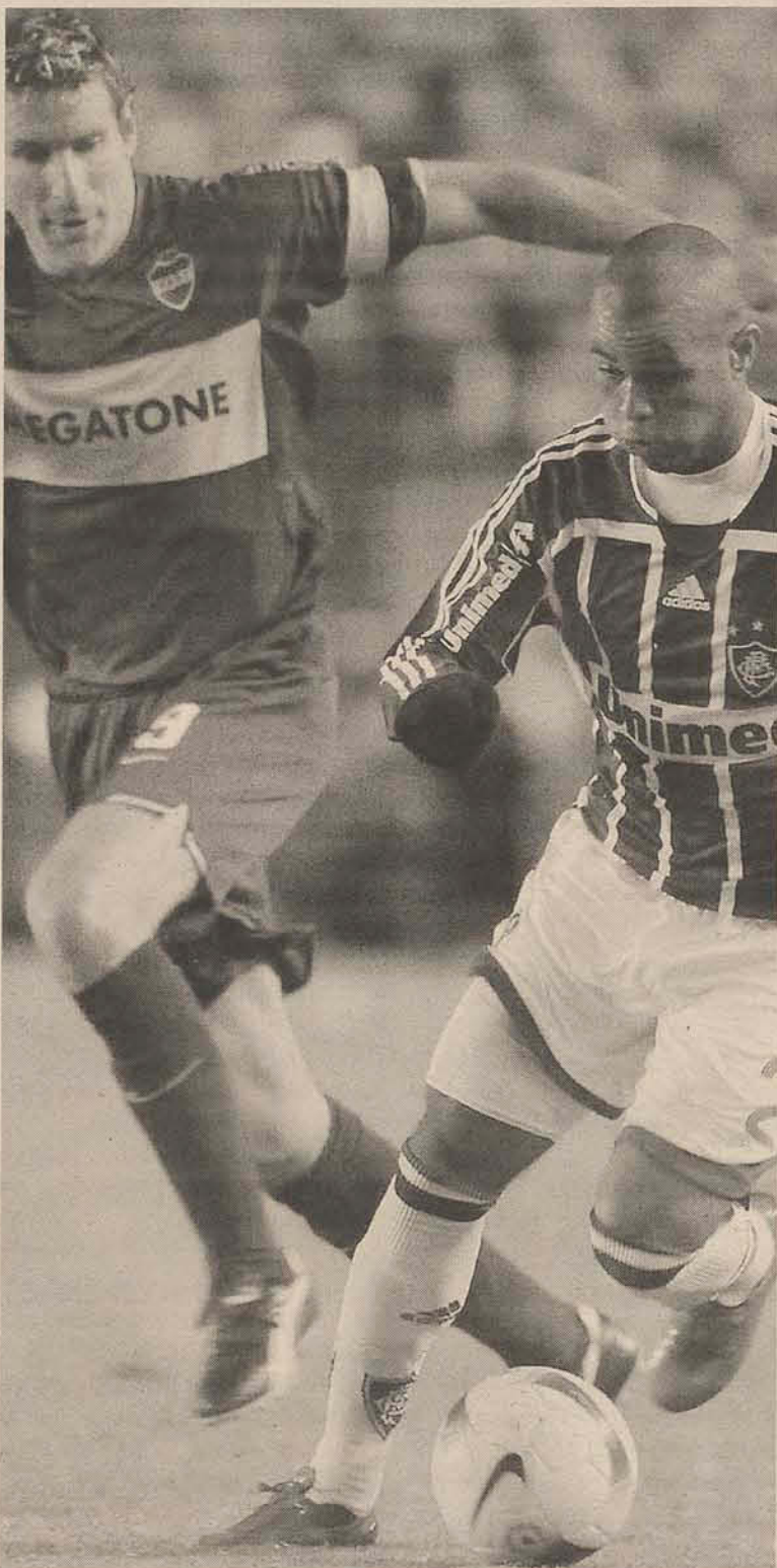
Time carioca conquistou um empate heróico e está perto da decisão

O Boca Juniors chegou ontem ao Rio de Janeiro trazendo na bagagem duas grandes dúvidas. O treinador Carlos Ischia pensa em promover o retorno do lateral-direito Hugo Ibarra, cujo lugar foi ocupado pelo zagueiro Maidana, improvisado. Quem também pode ganhar uma vaga entre os titulares é o meio-campo colombiano Fabián Vargas, no lugar de Cristian Chávez. Após a vitória dos reservas do Boca sobre o Arsenal (3x1) o técnico da equipe argentina se mostrou muito confiante na classificação da equipe à decisão do torneio sul-americano. Já Riquelme está confirmado no time titular.