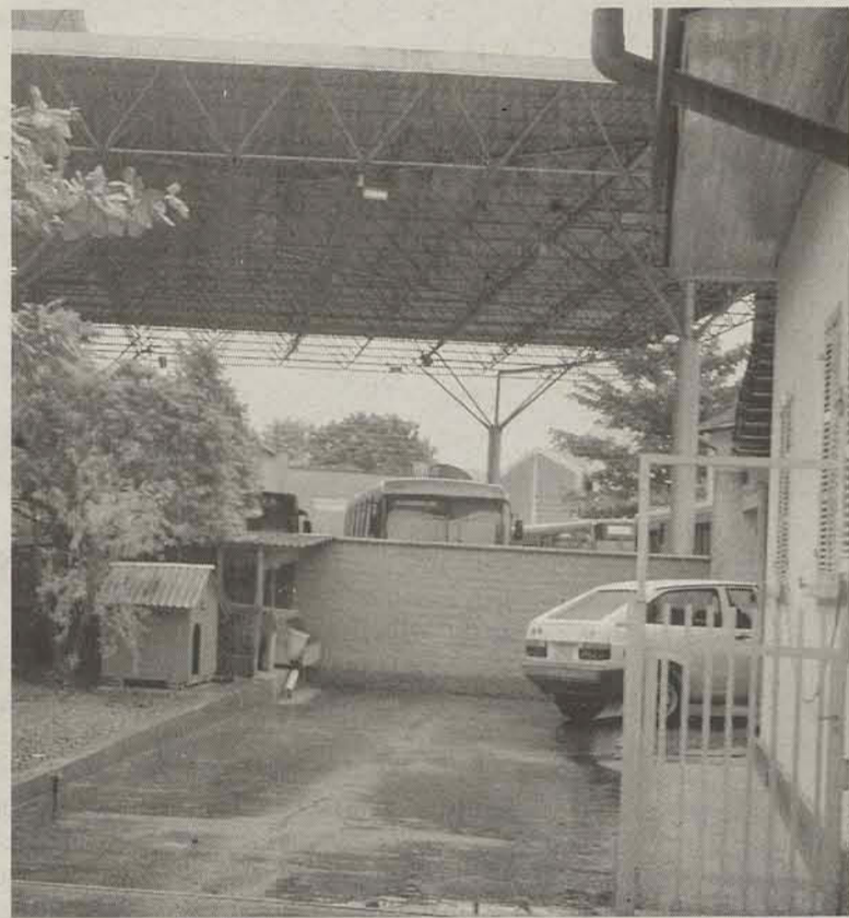
Imóvel será integrado às obras do novo terminal, a cargo da Canarinho