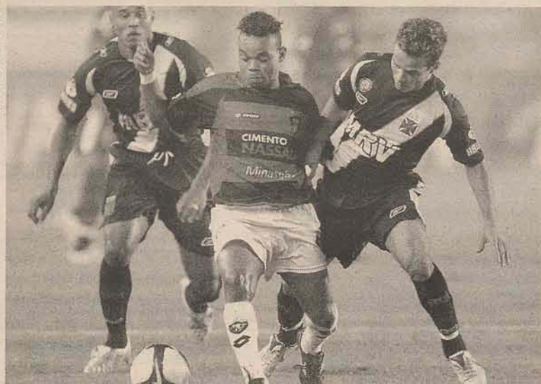
Time nordestino chegou a final da Copa do Brasil após vencer o Vasco