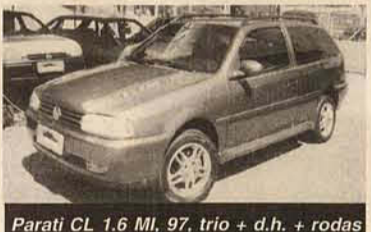
Parati CL 1.6 MI, 97, trio + d.h. + rodas