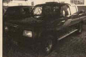
D-20 CABINADA DE FÁBRICA 1993