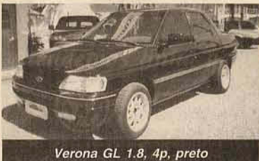
Verona GL 1.8, 4p, preto