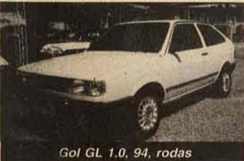
Gol GL 1.0, 94, rodas

Temos toda a linha de veículos OKm, com os menores preços