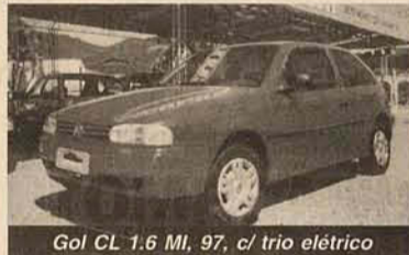
Gol CL 1.6 MI, 97, c/ trio elétrico