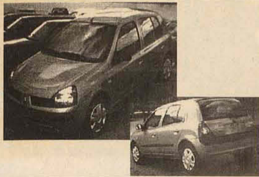
RENAULT CLIO 1.0, 4P - 0 KM COMPLETO