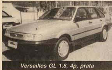
Versailles GL 1.8, 4p, prata