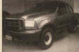
F-250 XL 1999