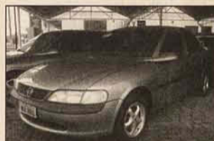
VECTRA GLS COMPL. 1997