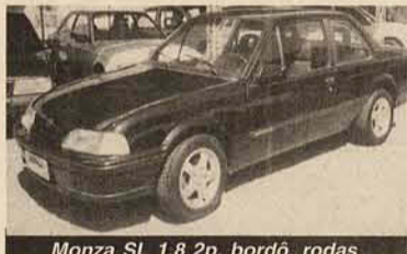
Monza SL 1.8 2p, bordô, rodas