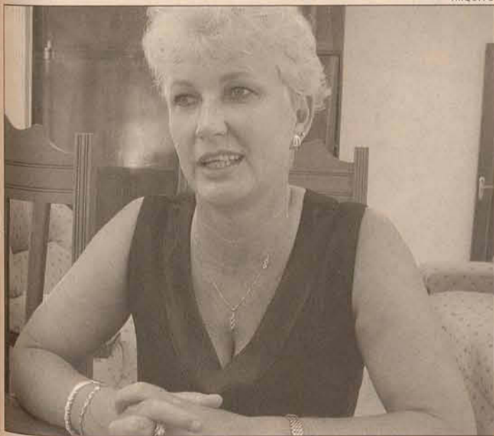
"Tenho a responsabilidade moral de concorrer novamente às eleições"