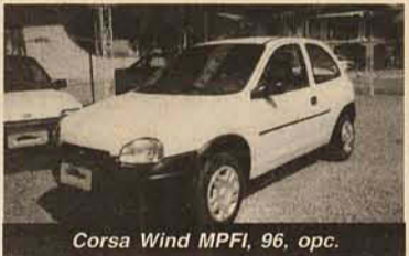
Corsa Wind MPFI, 96, opc.