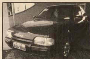
ESCORT HOBBY 1996