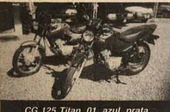
CG 125 Titan, 01, azul, prata