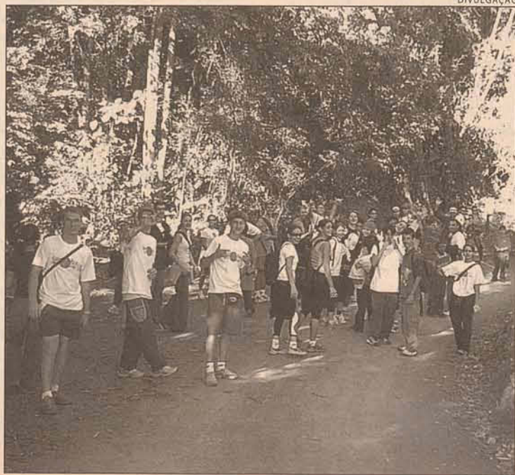
Adesão da comunidade para fazer caminhadas ecológicas

e montanhas, um cenário típico rural com destaque para a agricultura familiar e ainda cercada pelo principal cartão postal da região, a Serra do Jaraguá. O trajeto poderá ser completado em duas a três horas de caminhada, com vários pontos onde são feitas paradas para descanso e lanche. “Nós recomendamos aos participantes: vestir roupas leves, calçar tênis antiderrapante ou tênis confortáveis e levar água e lanche, protetor solar, repelente de insetos”, diz Rocha. O projeto “Caminhadas Ecológicas” conta com patrocínio de empresas da região e ainda com o apoio do Samae e prefeituras de Jaraguá do Sul, Schroeder, Guarimirim e Corupá.