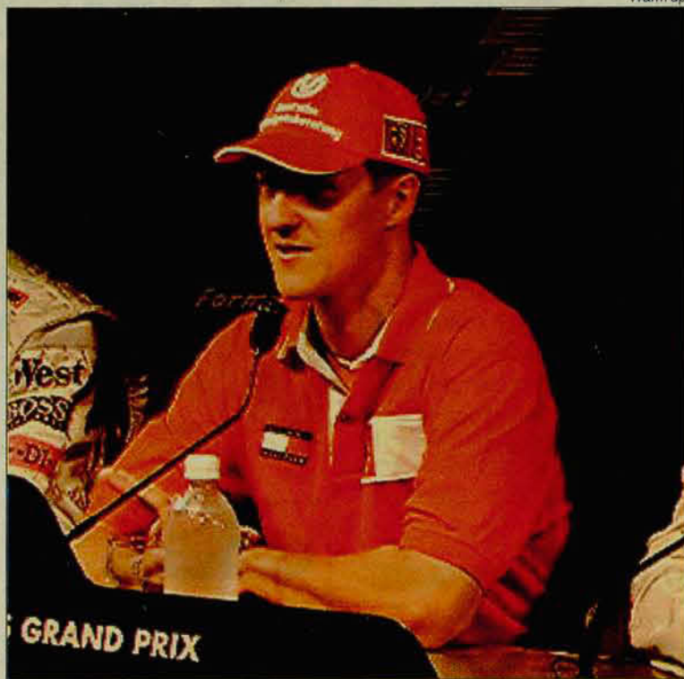
Pódio: alemão da Ferrari está perto de conquistar o tricampeonato

Outra possibilidade para Schumacher é conseguir marcar dois pontos mais que o finlandês na próxima etapa. Um segundo lugar do ferrarista, com Mika em terceiro, já daria o título ao alemão, que iria a 94 pontos, contra 84 de Hakkinen, que, então, poderia no máximo empatar com seu rival vencendo