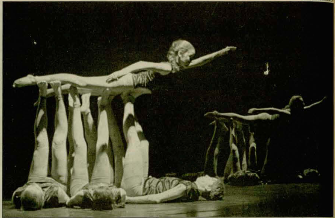
Modalidade contemporâneo: a Cia de Dança Entricorpus conquistou o segundo lugar na categoria juvenil.

Na categoria infanto-juvenil classificou-se em 3º lugar na modalidade contemporâneo o Grupo de Dança Beth Borba; na modalidade livre, também em 3º lugar, classificou-se o Grupo Lígia Rocha. Na categoria juvenil, classificou-se em 3º lugar o Grupo Incórcoris e em 2º lugar o Cia de Dança Entricorpus, na modalidade contemporâneo. Na modalidade jazz, ganhou o troféu de 2º lugar o Grupo de Dança do Centro Cultural; como dança moderna, ficou em 3º lugar o Grupo Jandança; na modalidade livre, dois grupos da coreógrafa Lígia Rocha obtiveram 2º e 3º lugares. (LISANDREA COSTA)