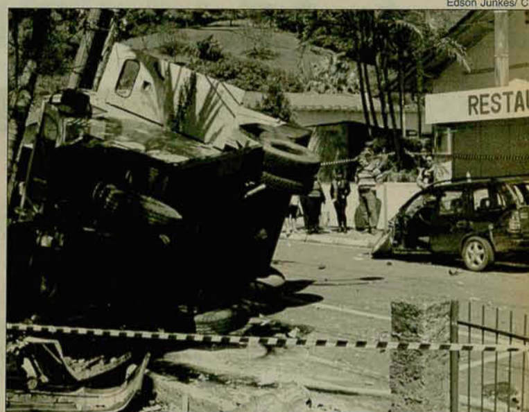
Colisão: testemunha diz que carro-forte cortou a preferencial do Corsa